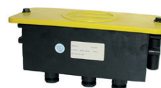
Signalklemmverteiler Typ 2712