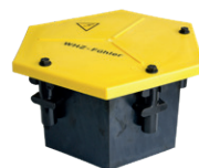
Klemmverteiler Type 2612