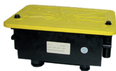
Signalklemmverteiler Typ 2518